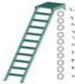
شكل (١) سلم تقدير التفكير الإيجابي لدي معلمة الروضة

- مع شرح سبب اختيارها هذا المكان علي سلم تقدير التفكير الإيجابي شكل (١)